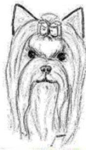
Oreilles trop larges