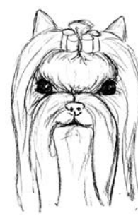
Crâne trop large Yeux trop espacés