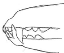
Articulé en ciseau parfait

Les dents sont bien disposées et les mâchoires sont d'égales longueurs. Les dents sont bien disposées et