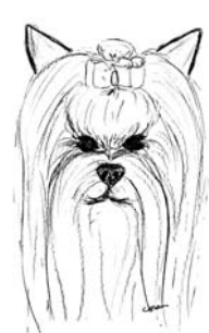
Oreilles divergentes Yeux trop rapprochés