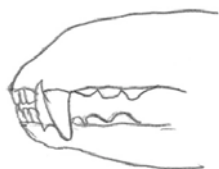
Articulé en pince