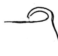
Queue trop sur le dos