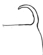
Attache de queue correcte