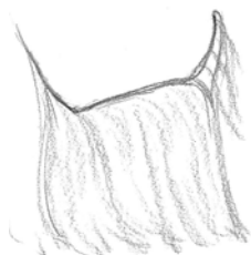
Dos plongeant à l'avant