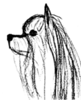
Museau trop court