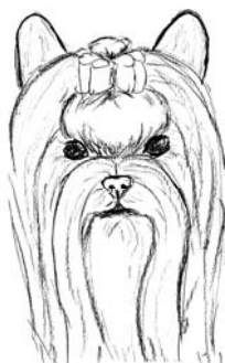
Oreilles trop rondes Yeux espacés