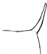
Excellent port de queue

Sa longueur participe à l'équilibre des formes.