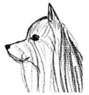
Museau trop long et plongeant