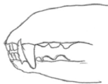
Articulé en pince