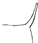
Excellent port de queue

Queue non coupée : Poil abondant, d'un bleu plus foncé que sur le reste du corps, surtout à l'extrémité. La queue est portée un peu plus haut que la ligne du dos. Aussi droite que possible. Sa longueur participe à l'équilibre des formes.