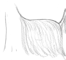
Dos voussé attache de queue basse

QUEUE : Auparavant la coutume était d'écourter la queue.