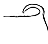
Queue trop sur le dos