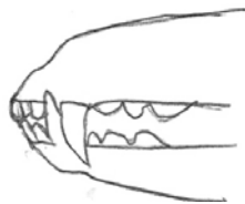
Articulé en ciseau parfait

Les dents sont bien disposées et les mâchoires sont d'égales longueurs. Les dents sont bien disposées et les mâchoires sont d'égale longueur.